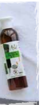
Flacon de 250 ml

GEL DOUCHE à l'Aloe Vera 81 % Bio & Equitable Notre Aloe Vera *Natif est fabriqué à partir de pulpe préparée au Mexique selon les critères du Commerce Equitable établis par Opéraequa. Il traverse facilement l'épiderme pour aller nourrir le derme et l'hypoderme et activer la micro circulation sanguine grâce à sa richesse en vitamines et en acides aminés. Il accélère de ce fait la production de nouvelles cellules. Grâce à ses enzymes protéolytiques, l'Aloe Vera élimine les cellules mortes qui bouchent les pores de la peau et l'asphyxie.