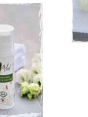
Flacon de 250 ml

PRODUITS ACTIFS : Aloe Vera frais Bio *Natif 81% issu du Commerce Equitable, huile essentielle Bio d'Epinette, *issu de la feuille fraîche. + de 81% du total des ingrédients sont issus de l'agriculture Biologique