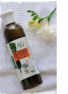
Flacon de 250 ml

GEL NETTOYANT & DÉMAQUILLANT à l'Aloe Vera 78 % Bio & Equitable Extrait manuellement des feuilles d'Aloe Vera Biologique cultivée au Mexique, (gel NATIF). Hydratant et astringent, notre gel nettoie la peau en respectant son pH et son film lipidique. Il nourrit la peau et la régénère grâce à sa richesse en vitamines, minéraux et acides aminés.