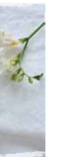
Tube de 50ml

PRODUITS ACTIFS : Aloe vera Bio *Natif 35 % issu du Commerce Equitable, Cire d'abeille, beurre de Karité, huile d'Amande douce, huile de Sésame, huile de Macadamia, extrait de Carotte. + de 40 % du total des ingrédients sont issus de l'agriculture Biologique