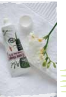
Tube de 50 ml

CREME VISAGE à l'Aloe Vera 30 % pénètre instantanément. UTILISATION : Appliquer une noisette de crème PURALOE, matin et soir sur le visage et le cou. Votre peau sera plus souple, plus fine et plus lisse. Mieux protégée, elle sera aussi plus tonique et paraîtra ainsi rajeunie.