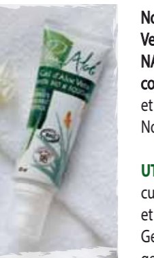
Tube de 125 ml

Notre GEL D'ALOÉ extrait manuellement des feuilles d'Aloe Vera Biologique cultivées au Mexique, c'est donc un gel NATIF. Toutes les propriétés originelles de la plante sont ainsi conservées. L'aloé Vera a une grande capacité de retenir l'eau et il peut pousser sous des climats très arides et très chauds. Non gras, il pénètre instantanément sans laisser de trace.