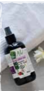
Flacon de 250 ml

PRODUITS ACTIFS : Aloe Vera Bio *Natif 76,7% issu du Commerce Equitable et 20 % d'Eau de Rose Bio. * pulpe extraite de la feuille fraîche. + de 96% du total des ingrédients sont issus de l'agriculture Biologique