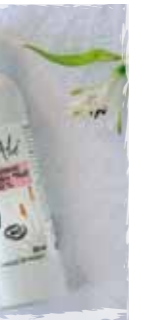
Flacon de 250 ml

UTILISATION : Appliquer en faisant pénétrer par un massage doux. PRODUITS ACTIFS : Aloe Vera Bio *Natif 30% issu du Commerce Equitable, huile d'Amande douce Bio et cire d'abeille. *pulpe extraite de la feuille fraîche. + de 32% du total des ingrédients sont issus de l'agriculture Biologique