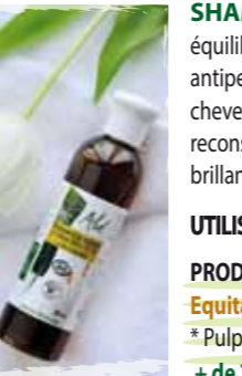
Flacon de 250 ml

SHAMPOOING à l'Aloe Vera 72 % Bio & Equitable équilibre le pH du cuir chevelu, possède une action antiseptique et antipelluculaire, il participe à la régénération cellulaire, et hydrate la fibre du cheveu. Les protéines d'Amarante gagnent le cheveu et participent ainsi à la reconstitution de son écaille. L'huile essentielle d'Epinette renforce la brillance naturelle du cheveu.